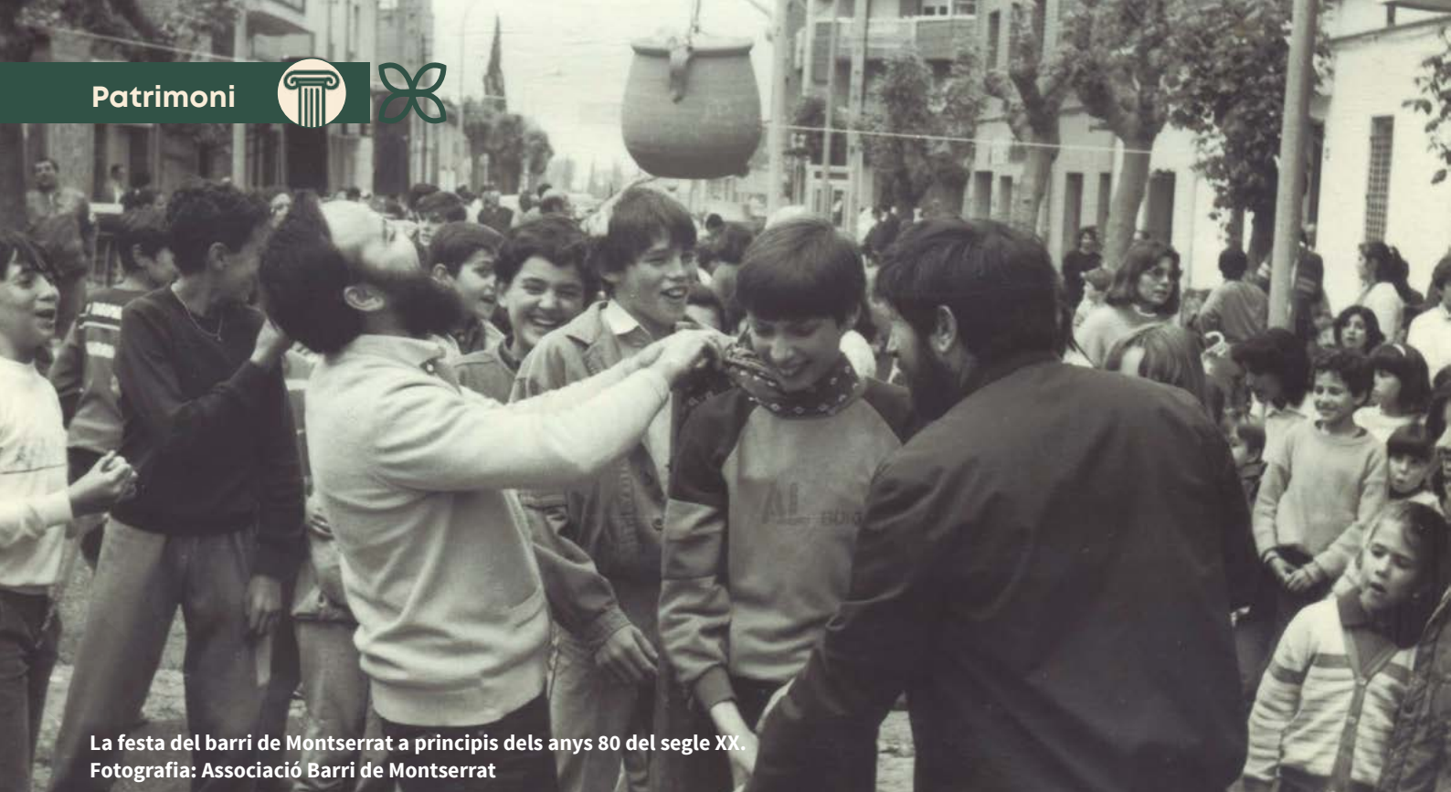
La festa del barri de Montserrat a principis dels anys 80 del segle XX.