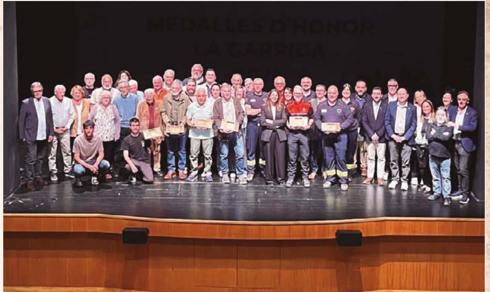
Foto de totes les persones distingides