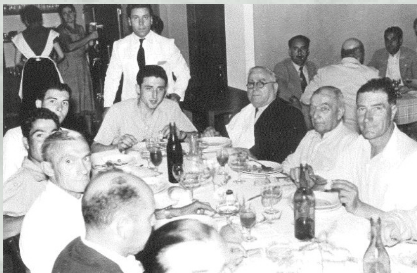
1954 Dinar de coristes a l'Hostal del Roure