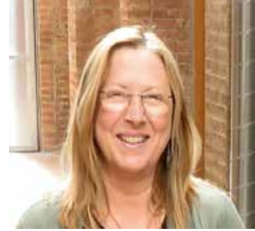
Dolors Castellà Puig Alcaldeessa de la Garriga