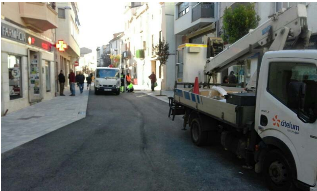
Vista dels treballs d'asfaltat del carrer Calàbria