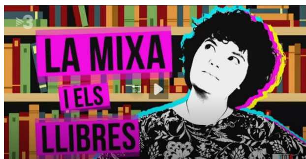
La Mixa col·labora al programa Tot es mou de TV3.

Per conduir aquest club de lectura tenim una gran moderadora: la Mixa, booktuber i especialista en tot tipus de novel·les per a joves.