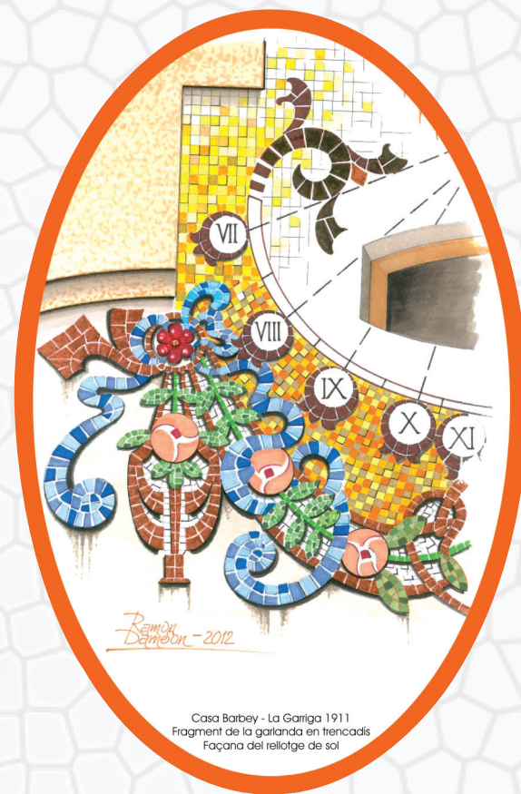
Casa Barbey - La Garriga 1911 Fragment de la garlanda en trencadis Façana del rellotge de sol