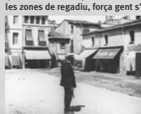
Ajuntament de la Garriga

L'Isidre Font, tal com diu la llinda, era corder. Feia cordes i espadnyes de cànem. I és que llavors, quan el poble tenia només dues-centes cases, onze d'aquestes es dedicaven a manufacturar cordes i espadnyes de cànem. Al segle XVIII, el cànem era un cultiu que, durant un temps, va donar molt bon rendiment econòmic. A la Garriga, aprofitant les zones de regadiu, força gent s'hi va dedicar, amb una producció que es distribuïa per bona part de Catalunya. I l'Isidre Font, aprofitant també el trànsit de gent pel camí ral, va posar-hi la seva botiga d'espadnyes.