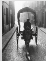
Cedida per Dani Soler

En plegar el ferret, s'hi va instal·lar una botiga de fruites i verdures, la majoria, encara, dels horts de la Garriga. Des de llavors, hi ha una gestoria, que potser ha fet servei alguna vegada a algun pagès, però que no té res a veure amb les necessitats de la Garriga rural. Resta, com a testimoni mut de la Garriga de fa 100 anys, la ferradura esculpida al brancal de la porta.