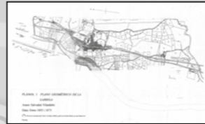
Ajuntament de la Garriga

Al segle XX, però, la masia de can Queló i tot el seu entorn ja havien canviat de funció: van estar ocupats pel gran escorxador municipal de la Garriga. Ara, a can Queló, no hi ha ni horts ni animals, i complex una funció ben contemporània: és la seu del Centre Excursionista Garriguenc.