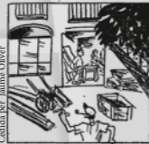
En treballs de fuster, el primer és l'Oliver.