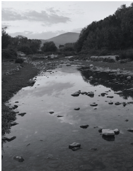
M. del Castell

Les persones interessades a conèixer l'entorn rural i natural del municipi i el patrimoni i els paisatges que ofereix ja poden descarregar-se els tracks per seguir les rutes que proposa el Centre de Visitants de la Garriga. Aquest nou recurs, que permet tenir el recorregut georeferenciat per GPS a través de la plataforma Wikiloc, és un pas més per a la difusió de l'oferta turística i patrimonial del poble i per