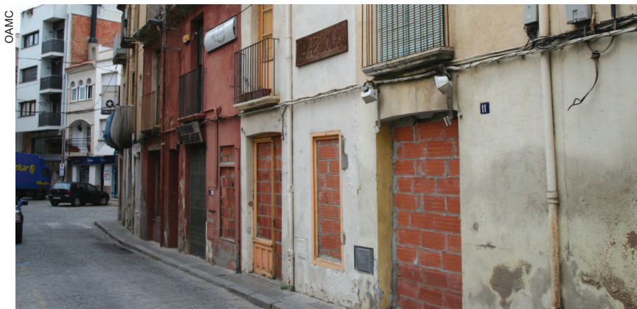
Els edificis, tapiats i abandonats, es troben al principi del carrer de Calàbria

Les cases abandonades i tapiades del principi del carrer Calàbria podrien enderrocar-se abans de l'estiu. Actualment s'estan enllestitint tots els tràmits administratius per validar el projecte de l'empresa promotora dels nous edificis que s'hi volen construir. També s'està redactant un pla de millora urbana.