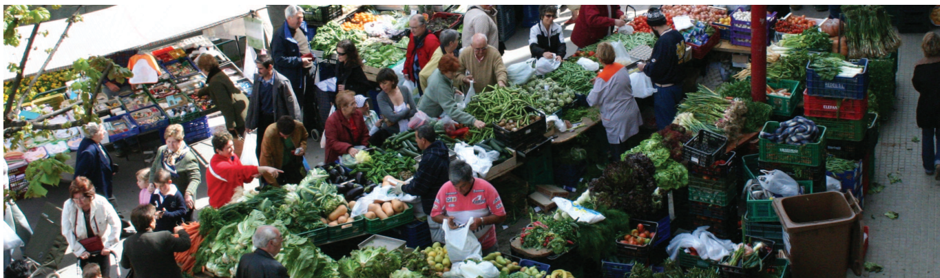
La iniciativa vetlla per garantir les condicions òptimes d'higiene, neteja i protecció dels aliments, entre d'altres aspectes.

Cinc municipis treballen en xarxa pel compliment dels requisits a les parades