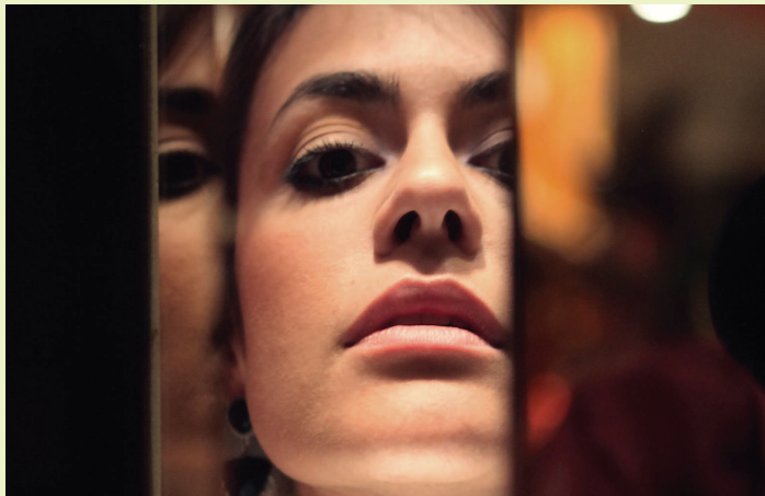
L'espectacle Thank you for the boots ha recollit elogis de la crítica musical del país