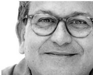
El festival homenatjarà el poeta Narcís Comadira

Tot i que es va iniciar a finals d'abril, el gruix d'activitats del Festival Primavera Poètica es concentra durant aquest mes de maig.