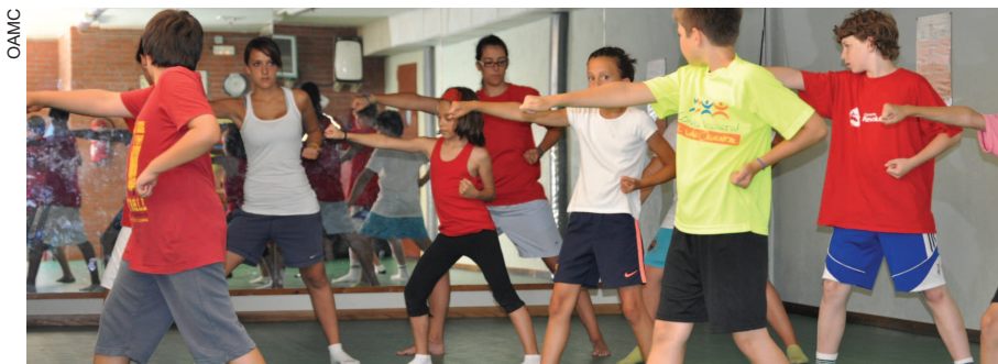
El casal d'estiu municipal es farà a l'escola Pinetons

El casal d'estiu municipal inclourà, aquest any, la possibilitat de quedar-se una nit a dormir per fer un taller titulat "Una nit d'estrelles". El casal, que durarà sis setmanes, té com a centre d'interès el Far West . Els nens i nenes tindran l'oportunitat, a través de tallers, jocs i excursions d'experimentar com vivien els indis. Activitats com construir tipis o tallers de pintura els permetran, segons els organitzadors, descobrir un món d'aventures i de sorpreses. Les inscripcions es faran a finals de maig.