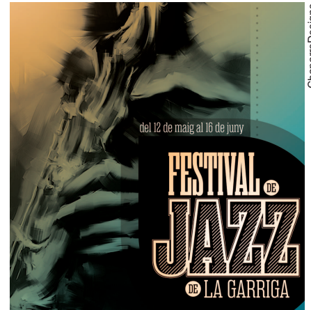
El festival ofereix un programa de qualitat

La programació inclourà activitats paral·leles, com són el 'Taller d'iniciació al jazz i a la música moderna' i la