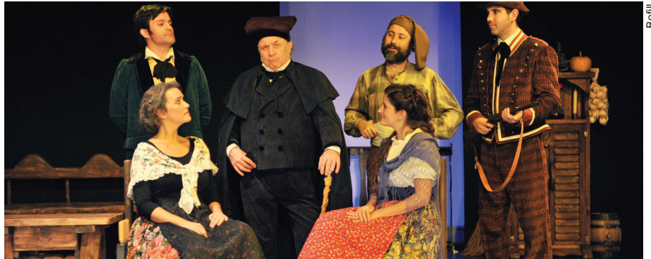
L'obra 'L'esquella de Torrassa' retrata la manera de fer d'un alcalde cacic de la meitat del segle XIX

I d'altra banda pujarà a l'escenari del Teatre el pianista Daniel Ligorio, considerat com un dels joves de més projecció del panorama musical nacional. El concert proposa un recorregut per la música catalana des del segle XIX fins al segle XXI fent homenatge a la figura de Xavier Montsalvatge en commemoració del centenari del seu naixement (1912-2012), a Frederic Mompou en commemoració dels 25 anys de la seva mort (1987-2012) i a Manuel Blancafort també en commemoració dels 25 anys de la seva mort (1987-2012). En aquest concert, que es farà el dia 26 de maig, es presenten també dues obres