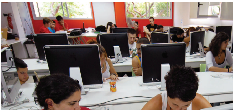
El cicle s'adreça a persones emprenedores amb ganes de canviar la seva situació laboral

L'Escola Municipal d'Art i Disseny (EMAD) engega un cicle de cursos monogràfics per emprendre nous camins. Es tracta de quatre cursos de preu assequible que pretenen aportar eines útils i alternatives per fer front al període econòmic actual. Els tallers començaran durant la segona setmana de febrer i les inscripcions es poden fer a la mateixa escola.