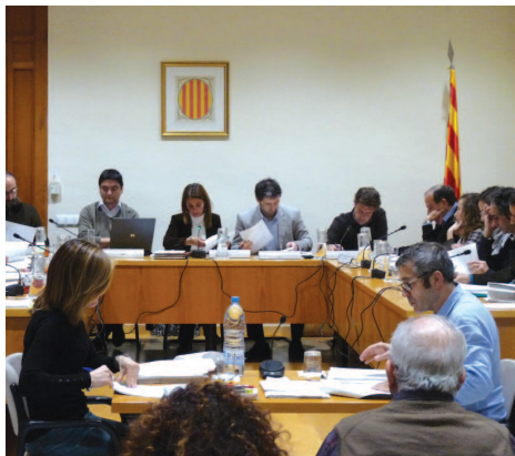
Els regidors i regidores durant el Ple