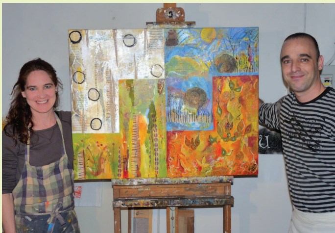
L'obra, pintada a quadre mans, representa les estacions de l'any