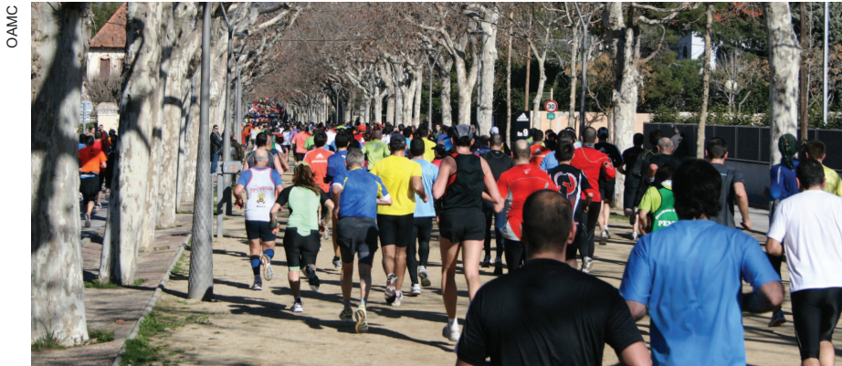
Més de 10.500 persones participaran a la prova esportiva

A la Garriga, el Passeig es farà de baixada