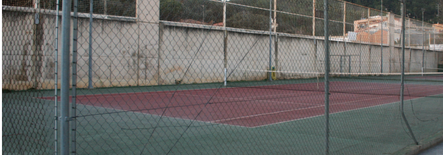
La pista s'equiparà per a entrenaments de bàsquet, handbol i futbol

Una de les dues pistes de tennis municipals de la zona esportiva de Can Noguera passarà a ser, ben aviat, una pista poliesportiva. Amb aquest canvi d'usos l'Ajuntament vol obrir la pista als clubs esportius locals i, d'aquesta manera, descongestionar el pavelló de Can Noguera, que es troba saturat per l'alt nombre d'entrenaments