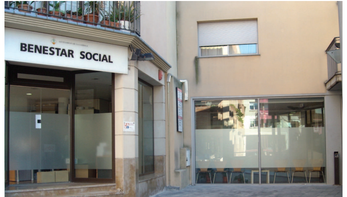
El Jutjat de Pau de la Garriga i les oficines de Serveis Socials deixaran els locals que ocupen actualment, que són de lloguer

L'Ajuntament estalviarà 40.000 euros l'any en lloguers de locals. D'una banda, el consistori deixarà l'espai que fins ara ocupen les oficines de Serveis Socials, situades al carrer de Samalús, que suposa una despesa de 30.000 euros anuals. Les oficines es traslladaran als baixos de la Biblioteca Núria Albó on, abans de fer el trasllat, es faran obres per adaptar l'espai als seus nous usos. Les obres estan pressupos-